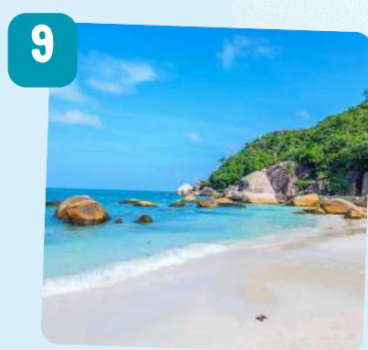
เกาะสมุย