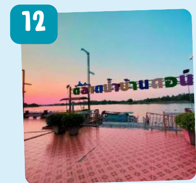
ตลาดน้ำบ้านดอน