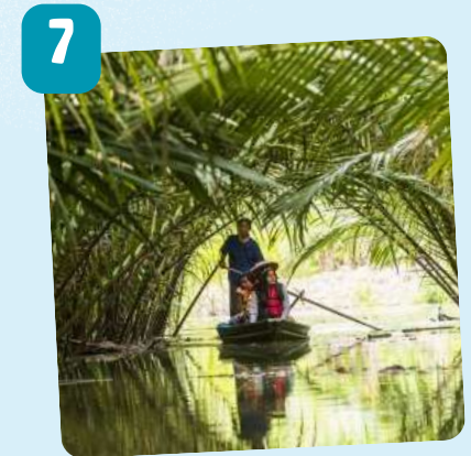
ตลาดน้ำประจักษ์