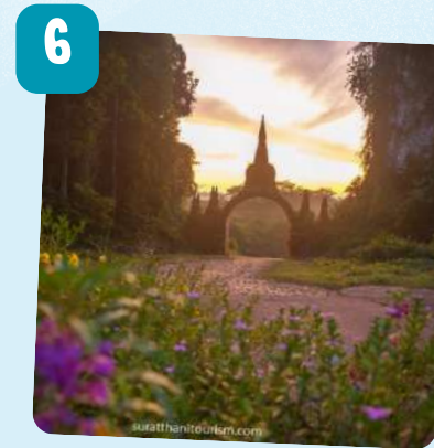
อุทยานธรรมชาติเขานาในหลวง