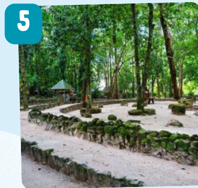
สวนโมกขพลาราม