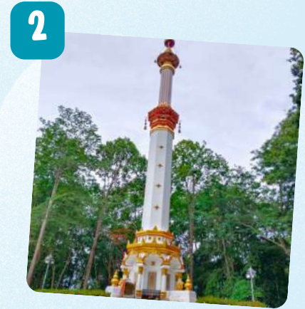
พระธาตุศรีสุราษฎร์