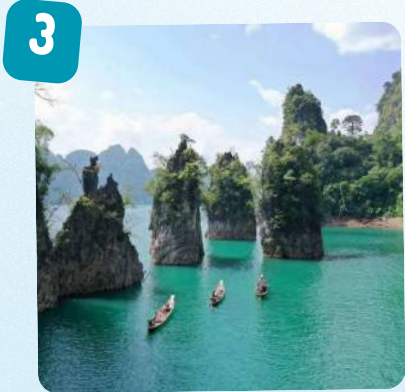
เขื่อนรัชชประภา