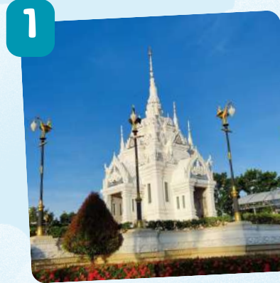
ศาลหลักเมืองสุราษฎร์ธานี