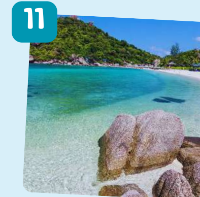
เกาะเต่า