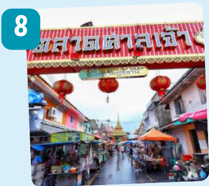
ตลาดศาลเจ้า