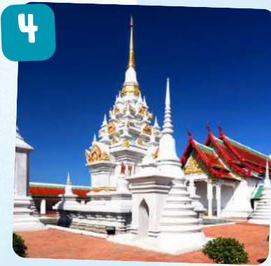
วัดพระบรมธาตุไชยา