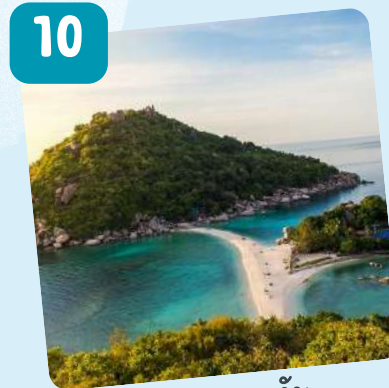
เกาะพะงัน