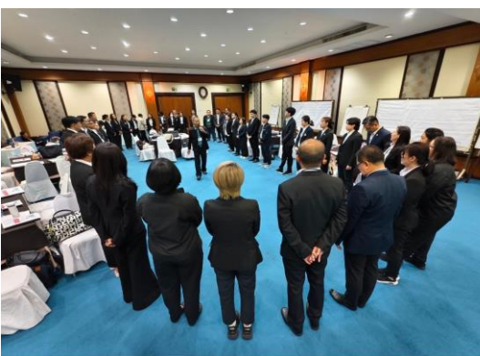
85mm f/2.67 1/33s ISO1725 14/02/2025 20:46