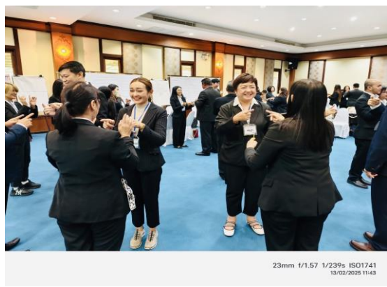
23mm 1/1.57 1/239s ISO1741 13/02/2023 11:43