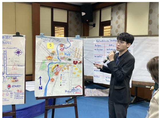
/๑๑.รูปภาพ...